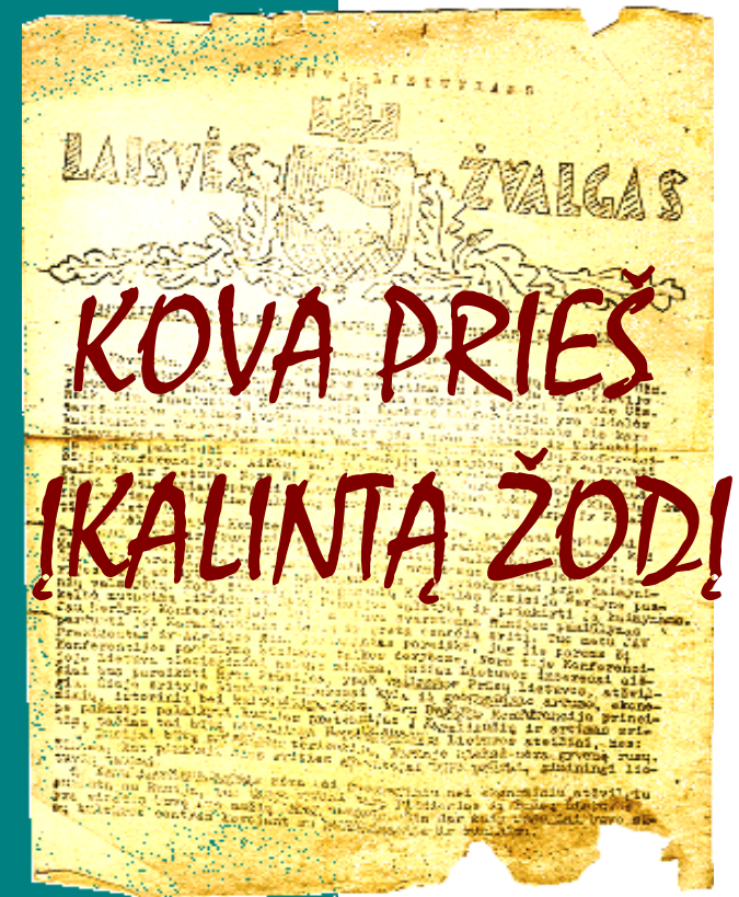
(Lietuviškos spaudos atgavimo 100 - osioms metinēms )