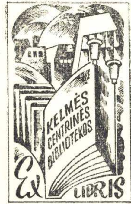
Ekslibrio autorius E.Žiauberis