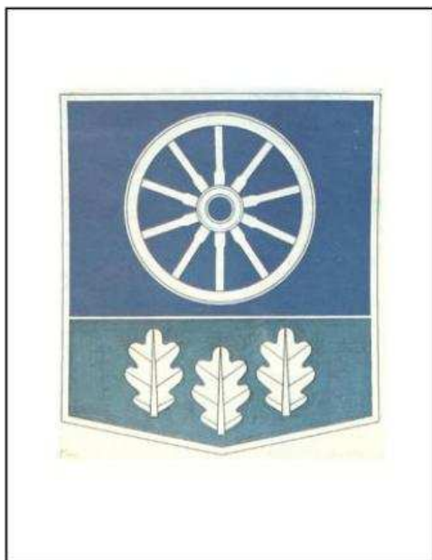
Kelmės herbas. Respublikinės heraldikos komisijos aprobuotas 1970 m. Herbą sukūrė dailininkas E.Žiauberis